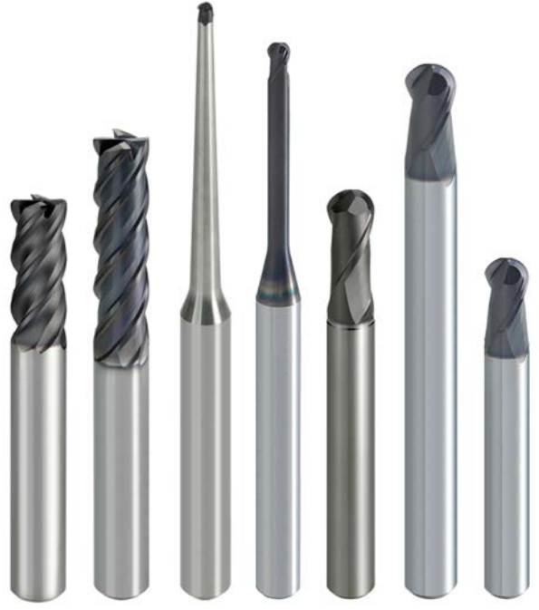
MS Plus parmak freze serisi

4 ağızlı, kesme boyu orta, düzensiz helis İNCELTİLMİŞ BOYUNLU TİP 2,5 X DC Ø6, Ø8, Ø10, Ø12, Ø16, Ø20